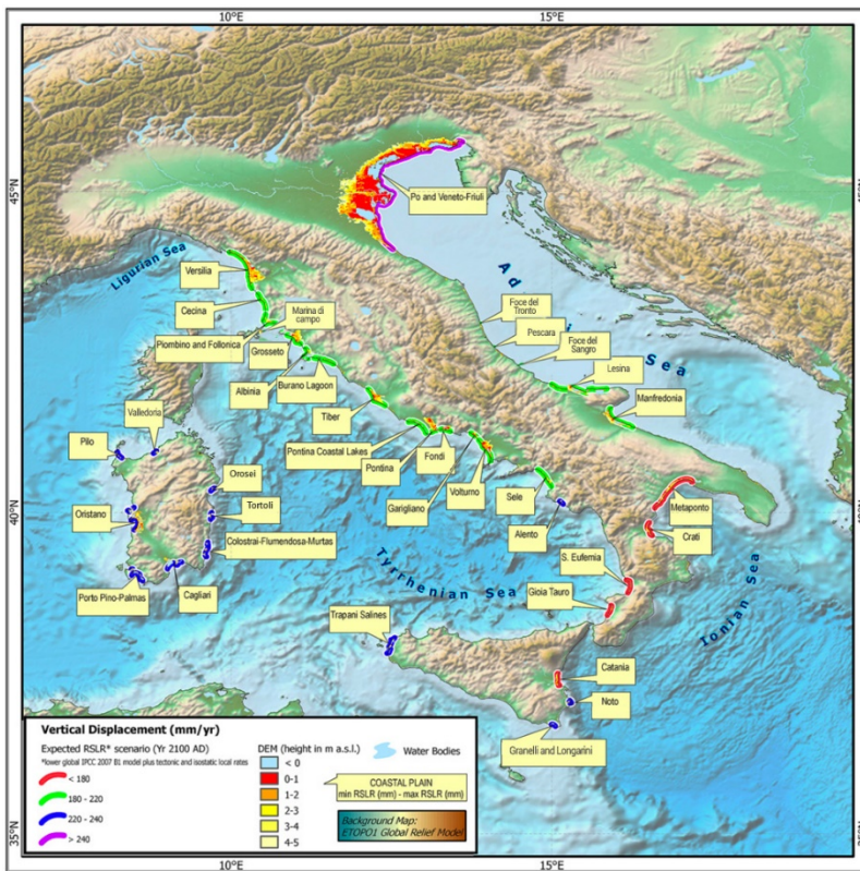
Aree costiere a maggior rischio di inondazione in Italia

Il Laboratorio di Modellistica Climatica e Impatti dell'ENEA sta per pubblicare un nuovo modello per il Mediterraneo.