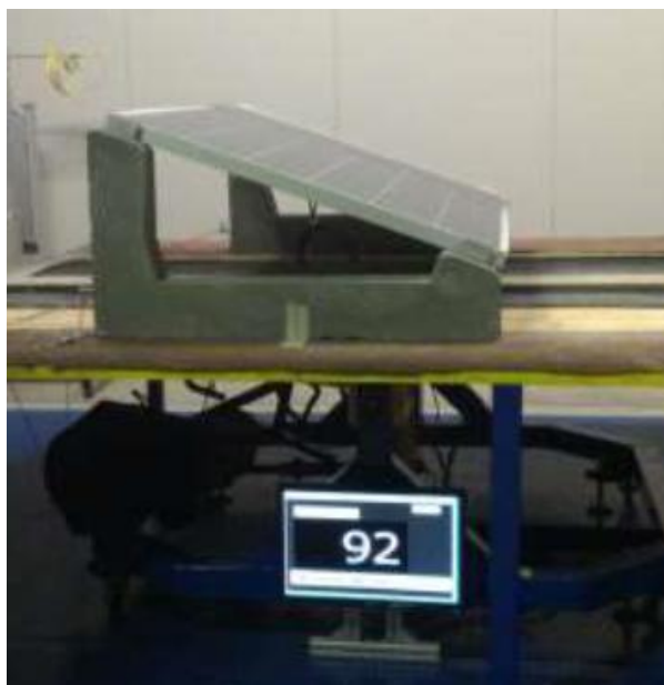
Test su zavorra 20°

Di contro qualcuno potrebbe obiettare un calo del rendimento dovuto alla scarsa inclinazione ma in realtà dai dati reali di produzione si è visto che ci sono altri fattori che incidono sulla produzione tra cui dimensione e lunghezza dei cavi lato DC, qualità moduli e inverter, ombre fisse ecc..