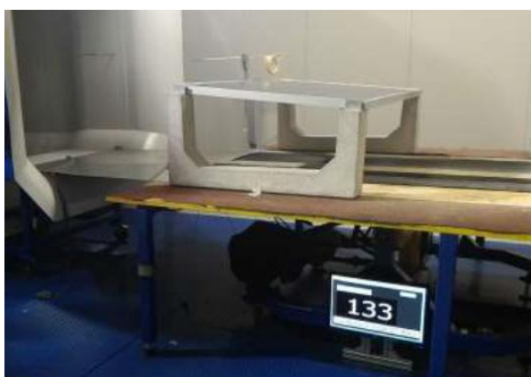
Test su zavorra 5°.4

Sunballast® desidera proporre al lettore una riflessione sulla scelta dell'inclinazione ottimale da dare al modulo FV, su coperture piane, mettendo particolare enfasi sul fattore vento; la normativa di riferimento (DM14/01/2008) ci fornisce una mappatura di base del territorio abbastanza attendibile. Inoltre le indicazioni di calcolo della normativa si riferiscono agli edifici, e nello specifico non ci sono direttive per il dimensionamento delle strutture fotovoltaiche.