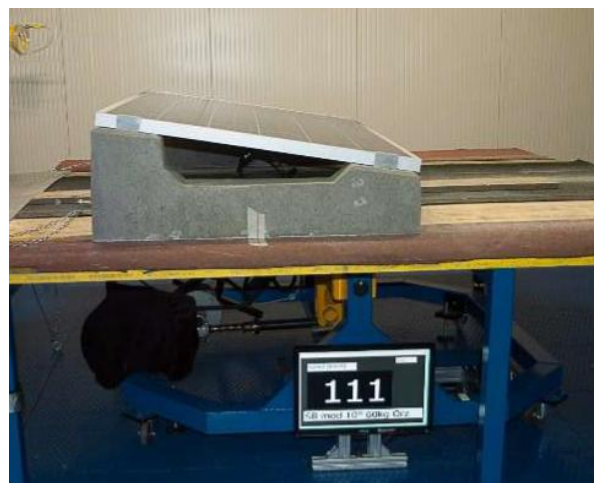
Test su zavorra 10° da 60 Kg

Le prove sono sostanzialmente di 2 tipologie: la prima è quella diretta su un modulo ancorato a 2 supporti Sunballast messi in galleria del vento, portando la velocità del vento fino al limite del ribaltamento. Questa prova è stata effettuata su tutti i modelli con inclinazioni che vanno da 0° a 35°, con moduli posati sia in verticale che orizzontale. La seconda tipologia di prova effettuata è stata realizzata su modello in scala ridotta di un edificio con sopra un impianto, registrando i CP (coefficienti di forma vento). In questo modo abbiamo avuto la possibilità di registrare la reale schermatura al vento data dalle file di moduli, dal parapetto e dall'edificio stesso.