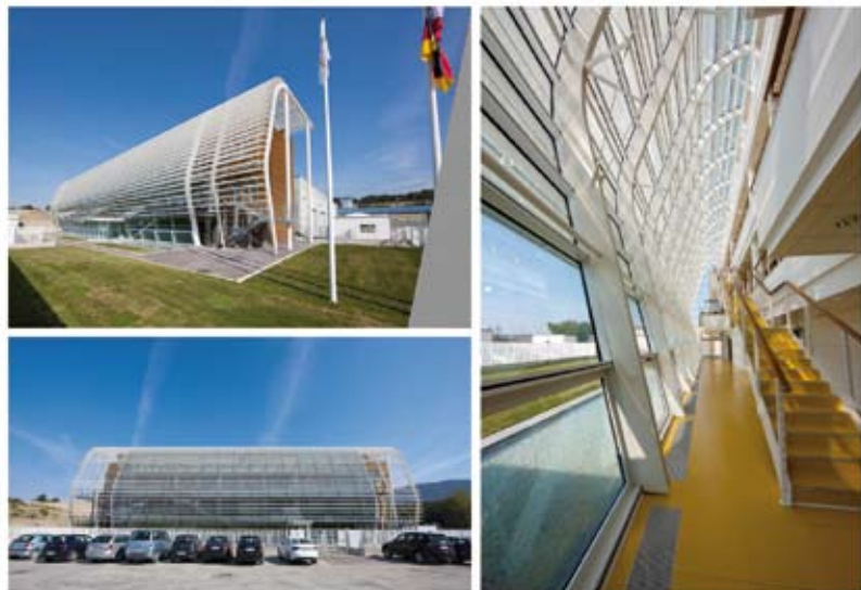
Nuova sede legale e stabilimento produttivo

Archimede Solar Energy (ASE), società del Gruppo Angelantoni Industrie S.p.A. partecipata al 45% da Siemens, è l'unico produttore al mondo di un ricevitore solare commercialmente disponibile per centrali termodinamiche, a tecnologia parabolico lineare, che utilizzano nitrati di sodio e potassio (sali fusi) quale fluido termovettore. Un impianto solare termodinamico a concentrazione sfrutta la componente diretta della radiazione solare per la produzione di energia elettrica. In aggiunta ai tradizionali metodi di captazione di energia solare presenti nei comuni impianti solari termici, questo tipo di impianto introduce un ciclo termodinamico con turbina a vapore (Ciclo Rankine) per la trasformazione dell'energia termica in energia elettrica, attraverso la produzione di vapore, come avviene nelle centrali convenzionali. Siemens entra nel capitale dell'Archimede Solar Energy nel 2008, acquistando una quota partecipativa del 28% per incrementare la propria posizione lungo la catena del valore e diventare il fornitore leader di soluzioni per impianti solari termodinamici. Due anni dopo, la multinazionale tedesca incrementa la sua partecipazione al 45% con l'obiettivo di favorire un rapido sviluppo della nuova linea produttiva di tubi ricevitori. La produzione a pieno regime avrà una capacità annua di 140.000 tubi ricevitori solari, pari a circa 250 MW elettrici